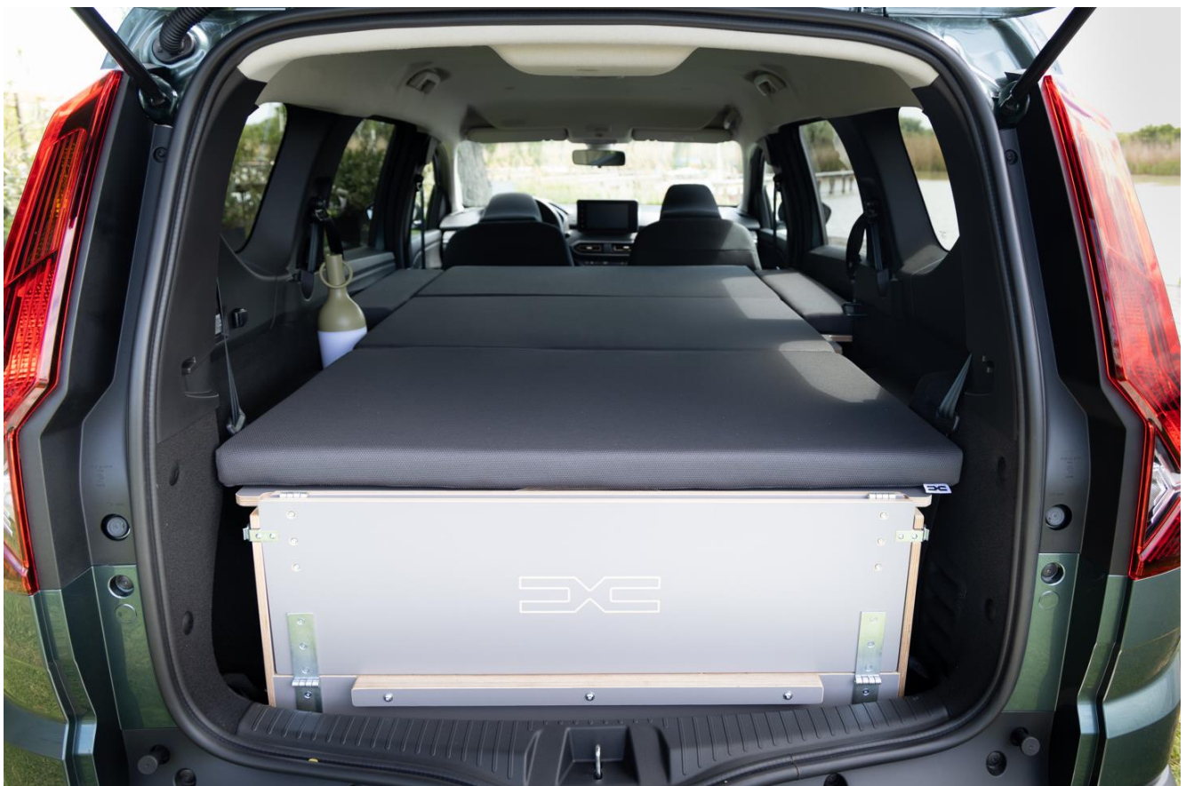
Dacia Jogger mit Sleep Pack

Nach dem Start in Kroatien folgen im weiteren Verlauf der Saison 2023 Läufe in ganz Europa (Spanien, Großbritannien, Frankreich, Italien, Österreich, Andorra, Slowenien, Schweden). In Österreich gastierte die UTMB® World Series bereits am vergangenen Wochenende in Salzburg beim „mozart 100 by UTMB®“. Neben der Präsentation des Dacia Spring wurde Läufer:innen und Publikum der neuen Dacia Jogger Hybrid 140 in der Ausstattungsvariante Extreme mit dem innovativen „InNature“ Sleep Pack präsentiert. Außerdem unterstützte Dacia Österreich das Team des „mozart 100“ mit einem Fahrzeugfuhrpark.